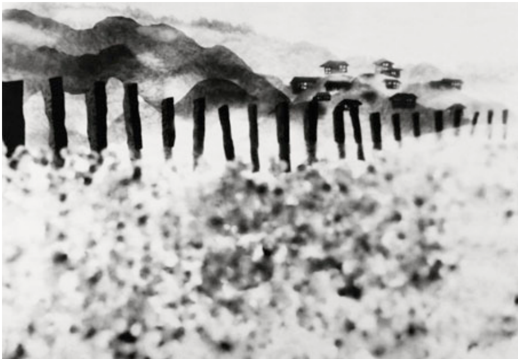
On the far away to home, 2014-2019