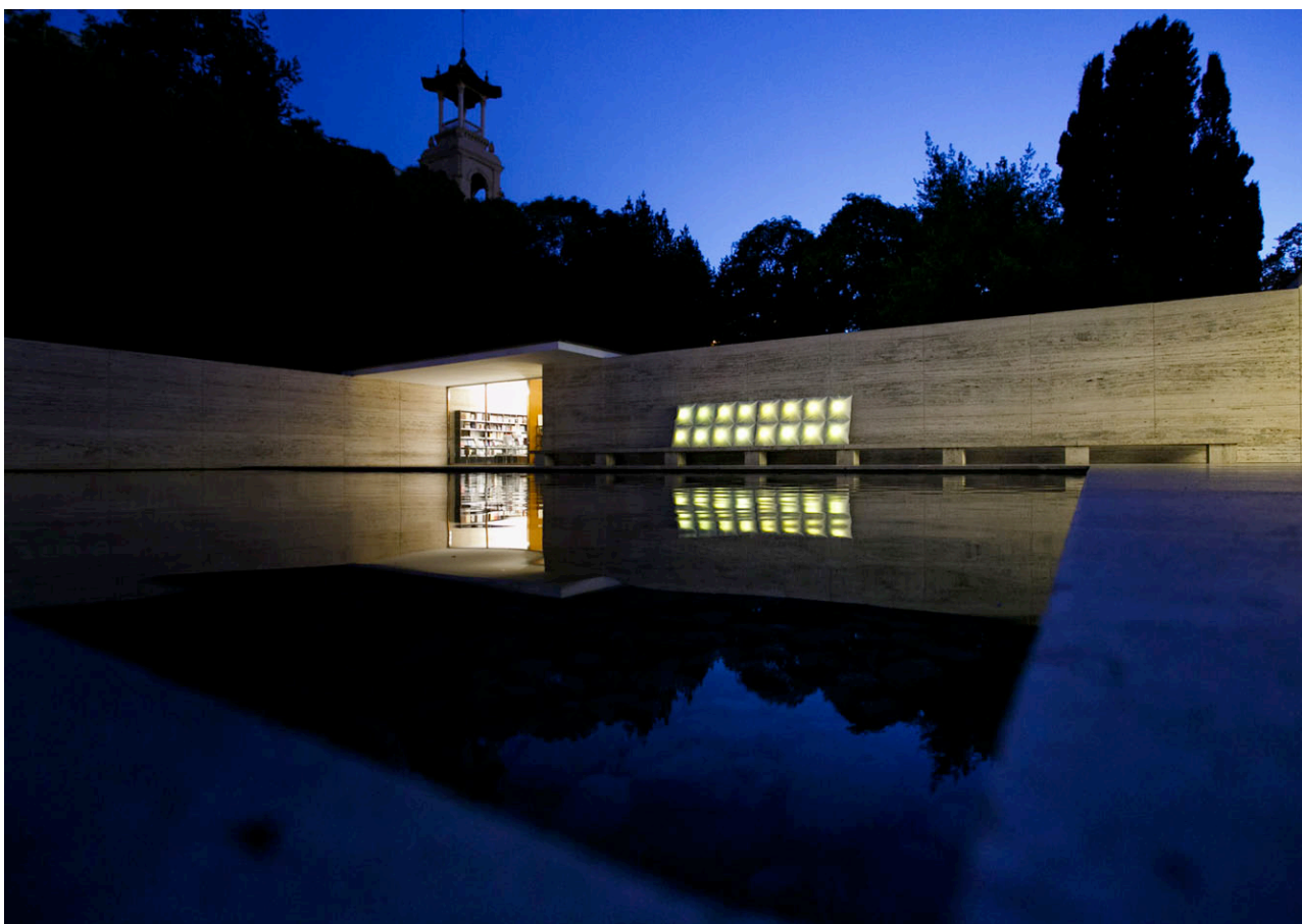
AKARI PL2 , 1975. papier, bambou et cordes

Collection de la Fondation Mies van der Rohe dans le cadre de * folding cosmos BARCELONA