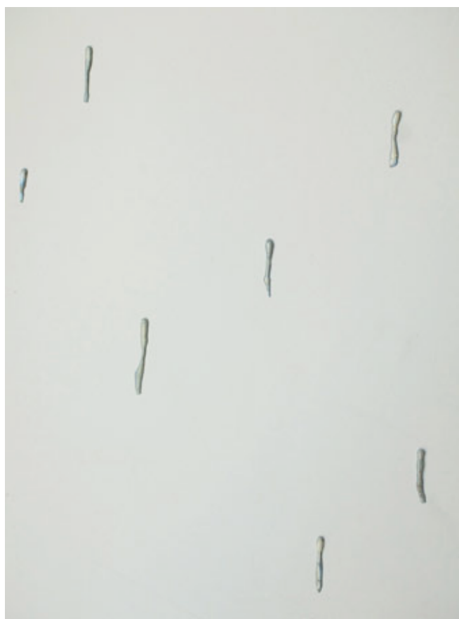
Evaporation II , 2019

Évaporation (2016-2017), collection de gouttes de porcelaine qui tombent vers le haut, transpose le thème de l'anti-gravité à des thèmes non architecturaux. Cette dernière version, créée spécialement pour la Maison Louis Carré, sera exposée sur le mur qui va du hall d'entrée au salon, comme une invitation adressée au visiteur à entrer dans un espace minimal japonais, flottant et mobile, renfermant son propre cosmos.