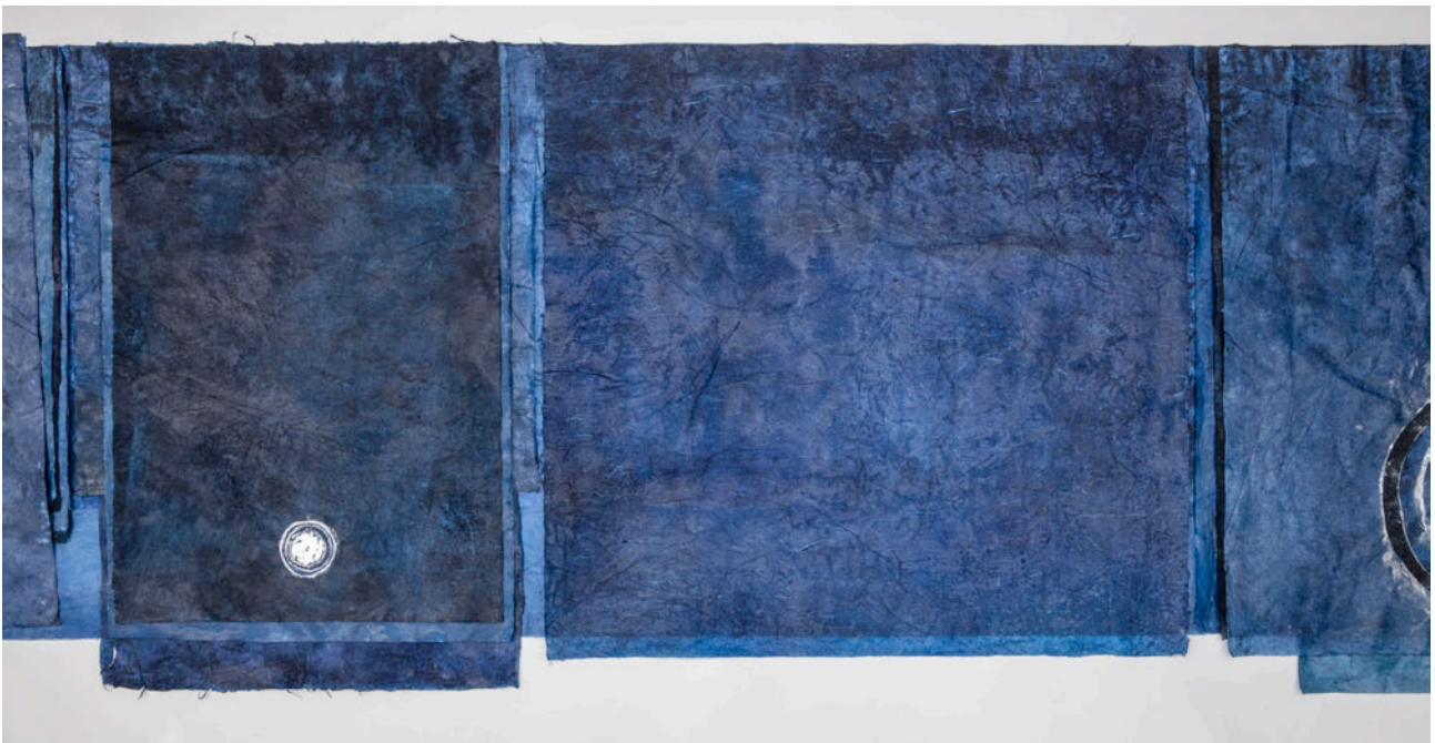
Void , 2019 (detail).